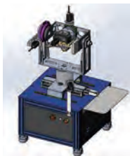
图 1 VR 延迟测试方案图