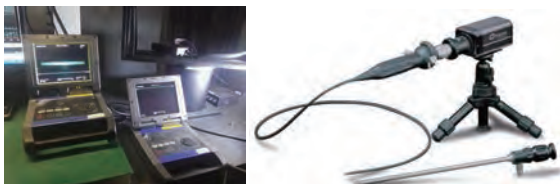
图 3 双摄像机控制器