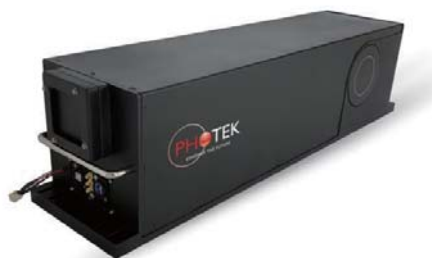
N-Cam 像增强型 Gadox-sCMOS 中子相机

Photek 公司最新推出的 N-Cam 是一款具有高灵敏度、高分辨率同时易于使用的中子相机。N-Cam 可实现快速层析中子成像、动态成像摄像、特定能量波段成像以及支持单中子计数模式。使用 N-Cam 相机，可在不牺牲分辨率和成像质量的基础上显著缩短采集时间。