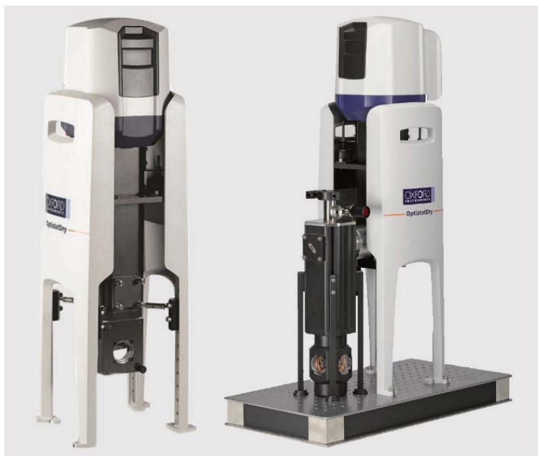
Optistat Dry BLV 底部换样真空型