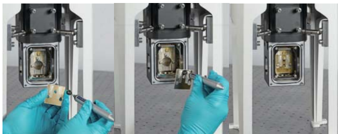
1、2、使用 Dryload 换样工具, 提起电学样品托并移除 3、完成换样